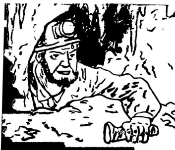
Mijnwerkerslamp: It's a long way to the W.C.!

Als het lichtlampje zich maximaal ver van mijn bed bevindt, slaap ik met zo'n mijnwerkerslamp op m'n hoofd. Het zal geen gezicht zijn, maar als ik midden in de nacht wakker word en ik voel dat ding op m'n kop, dan weet ik meteen dat ik niet als een gek de omgeving af